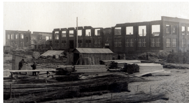
Vorderseite des Gebäudes in der Kamenzer Straße 12, 1950

Das ehemalige Hauptgebäude des KZ-Außenlagers in der Kamenzer Straße 12 ließ der Betrieb enttrümmern und instand setzen und nutzte es anschließend als Verwaltungsgebäude.