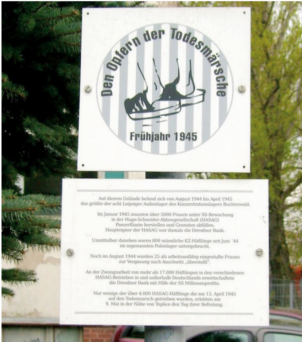
Wegzeichen und Gedenktafel an der Kamenzer Straße 10, initiiert von der Gruppe Gedenkmarsch zur Erinnerung an das KZ-Außenlager und die Opfer der Todesmärsche, 2012

Heute befindet sich das Gebäude im Leipziger Nordosten in privater Hand. Wie aus verschiedenen Debatten im Stadtrat und dem Sächsischen Verfassungsschutzbericht 2018 bekannt ist, dient das Gebäude, das einst ein zentraler Bestandteil des KZ-Außenlagers »HASAG Leipzig« gewesen ist, der militanten Rechtsradikalszene als Treffpunkt. Die heutige Nutzung des Gebäudes erschwert ein angemessenes Gedenken in hohem Maße. Die vor Ort angebrachte Gedenktafel und das Wegzeichen zur Erinnerung an das KZ-Außenlager und die Opfer der Todesmärsche wurden in der Vergangenheit in regelmäßigen Abständen zerstört.