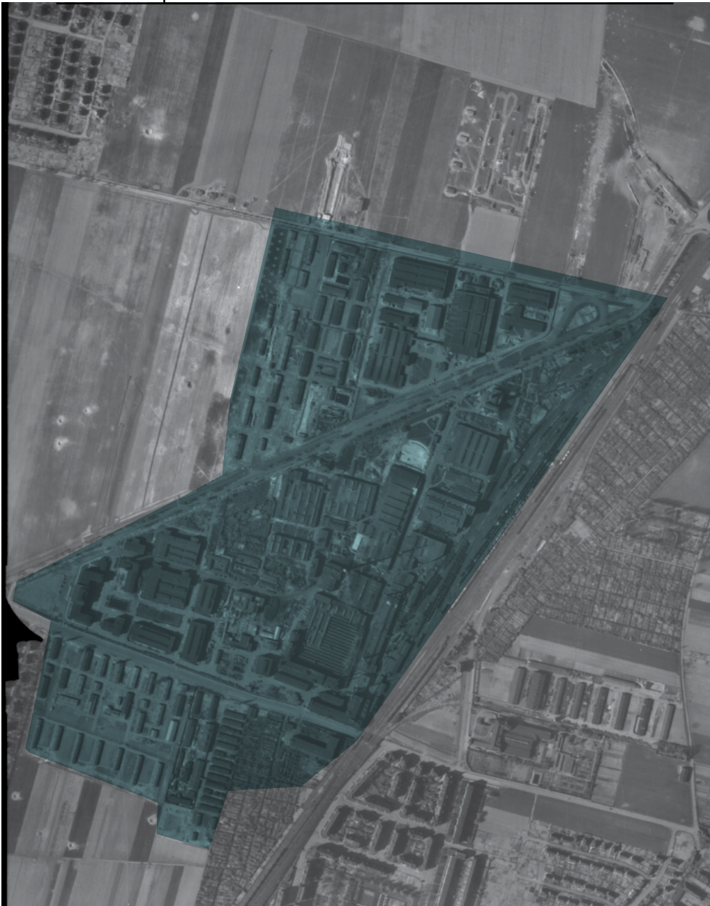
Das Luftbild der US Airforce vom 10. April 1945 zeigt das Werksgelände der HASAG in Leipzig. Im oberen Teil links ist das KZ-Außenlager sowie an der Straße das Gebäude der Kamenzer Straße 12 erkennbar.