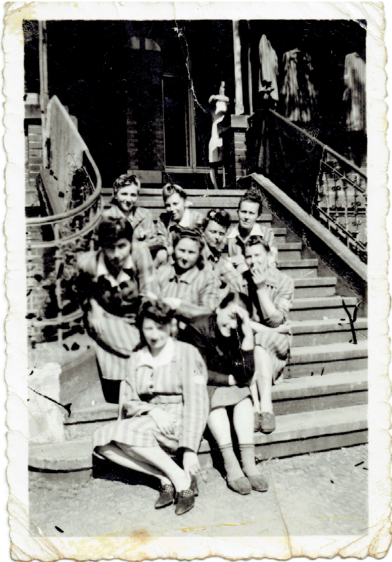
Befreite KZ-Häftlinge aus Leipzig in Wurzen, Mai 1945