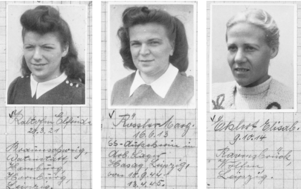
Die Fotos zeigen ehemalige KZ-Aufseherinnen, die im KZ-Außenlager »HASAG Leipzig« eingesetzt waren.

»Anfang April 1945 wurden wir aus dem Lager evakuiert und in verschiedene Richtungen geführt. Am meisten sind die weiblichen Häftlinge unterwegs umgekommen, weil die Schwächeren, die nicht mehr marschieren konnten, durch die begleitenden SS-Männer umgebracht wurden. Ich habe auch gesehen, wie die SS-Männer auf die Frauen schossen, die sich von der Kolonne entfernten, um aus den geöffneten Kartoffelmieten Kartoffeln zu nehmen.«